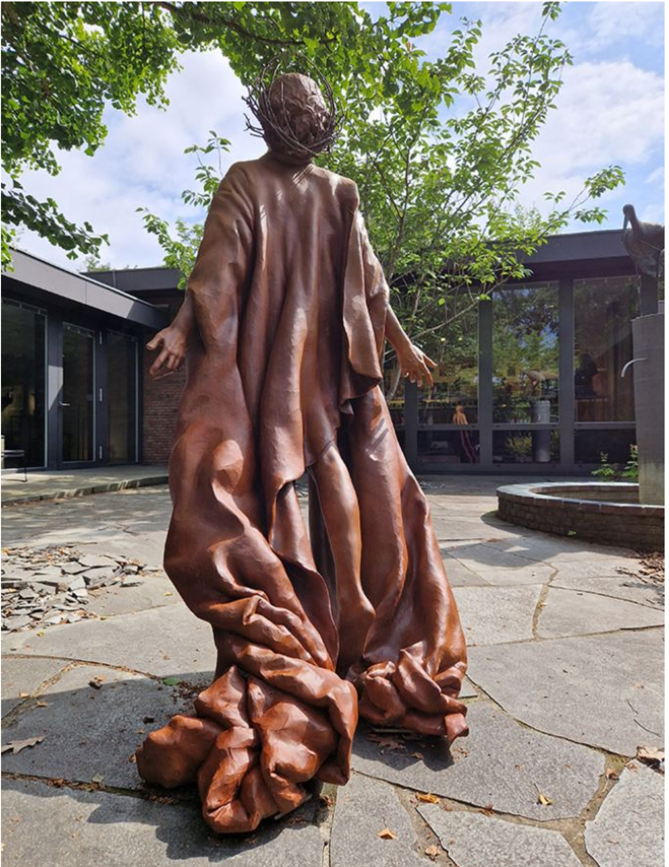
Antike Gewänder hautnah – am 3. Juli im Eisenkunstgussmuseum Büdelsdorf